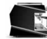
NERO OPACO MATT BLACK NEGRO MATE NOIR MAT MATTSCHWARZ